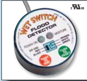
Interruptor detector de fluidos