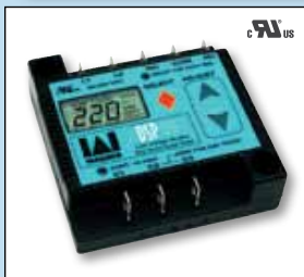
Monitor de línea de voltaje monofásico