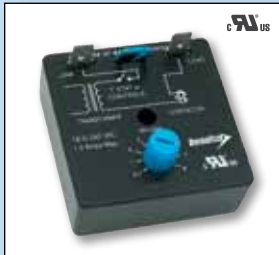
Regulador retardador de tiempo ajustable