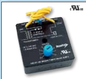
Regulador protector de tiempo ajustable